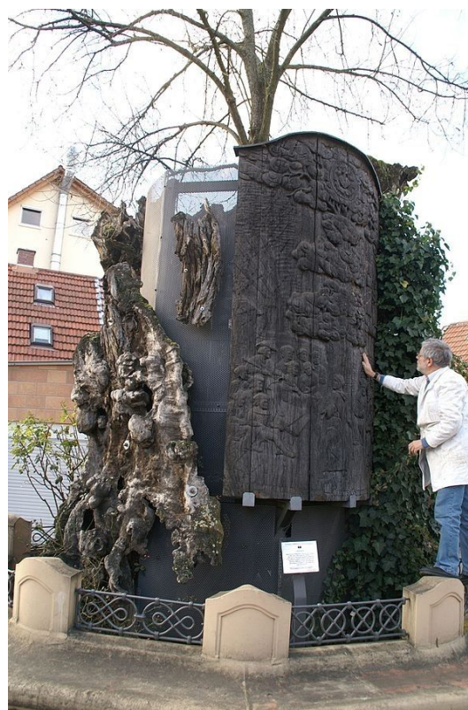
L'om de LUTER. L'arbre morí el 1949

Molt famosa és la plaga de la grafiosis causada pel fongs Ceratycistis (=Ophiostoma) ulmi, novo-ulmi . Ha afectat milions d'oms al món, especialment a Rússia. El contagi amb el fong els petits escarabats Hylurgopinus rufipes , Scolytus multistriatus . Tractaments amb àcid salicilic i carvacrol poden ser força eficaços.