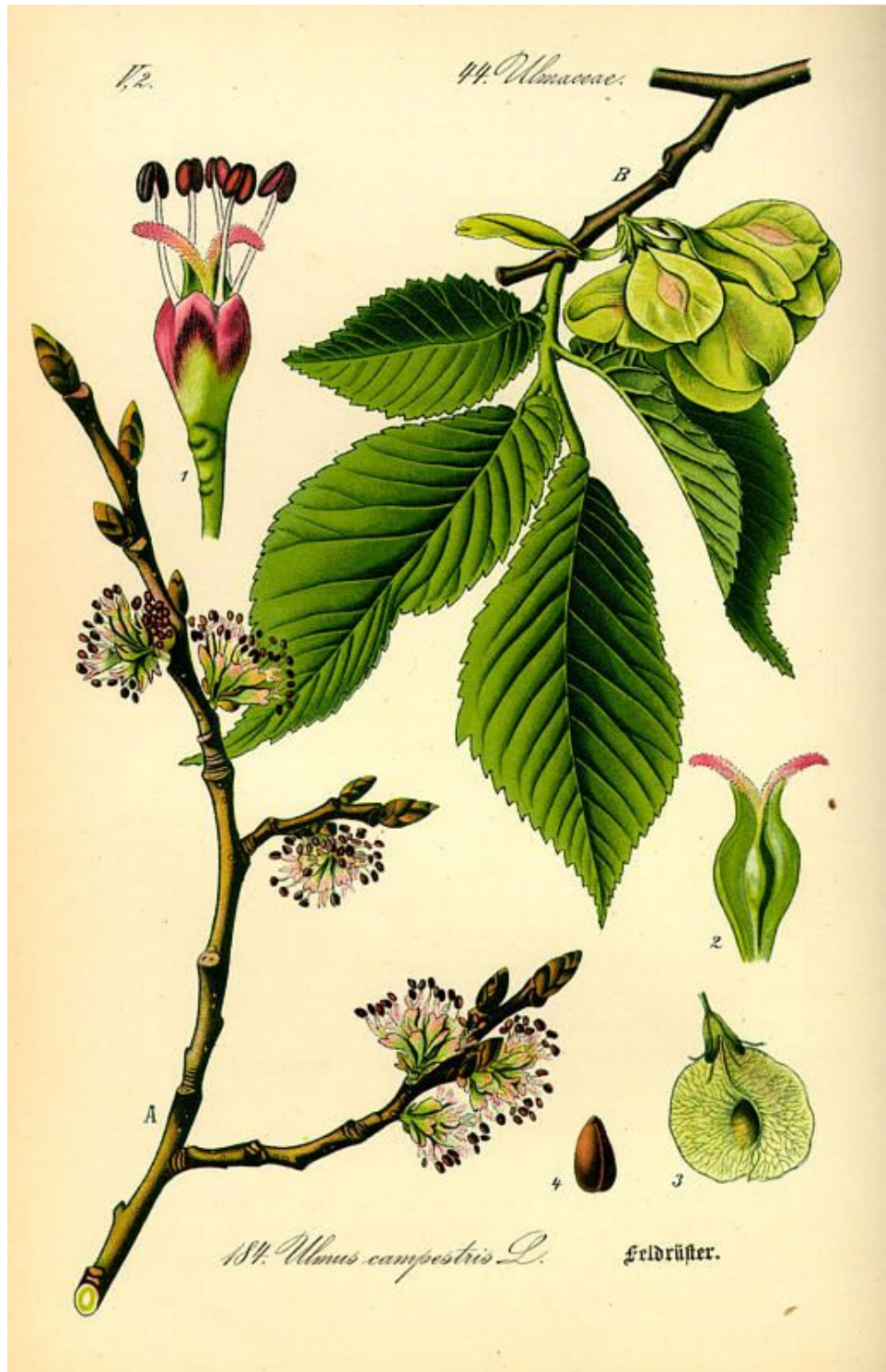
imatge de THOMÉ, OTTO WILHELM

[1768, Gard. Dict., ed. 8 : n° 6] 2n = 28