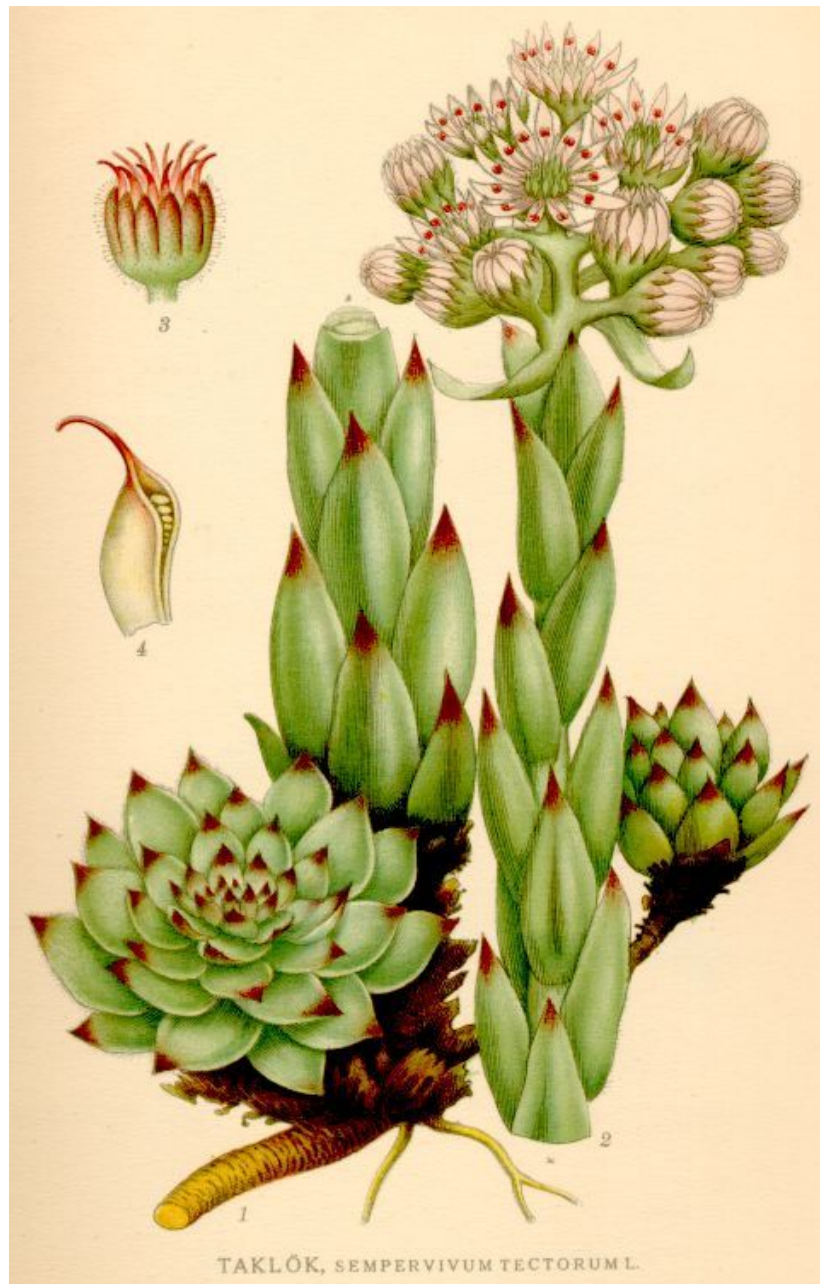
Sempervivum tectorum L. (imatge de CARL AXEL MAGNUS LINDMAN, a "Bilder ur Nordens Flora")