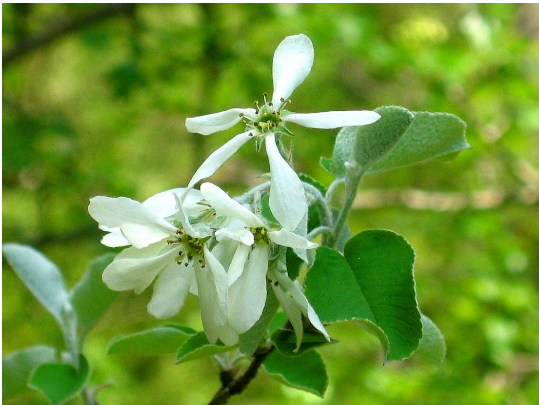
Amelanchier ovalis .