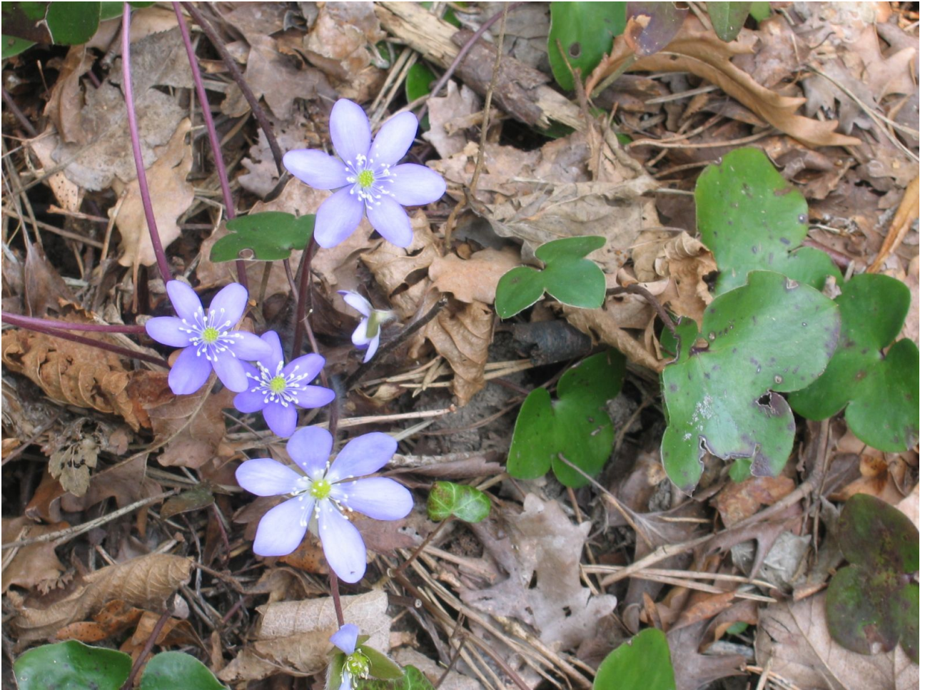
Anemone hepatica