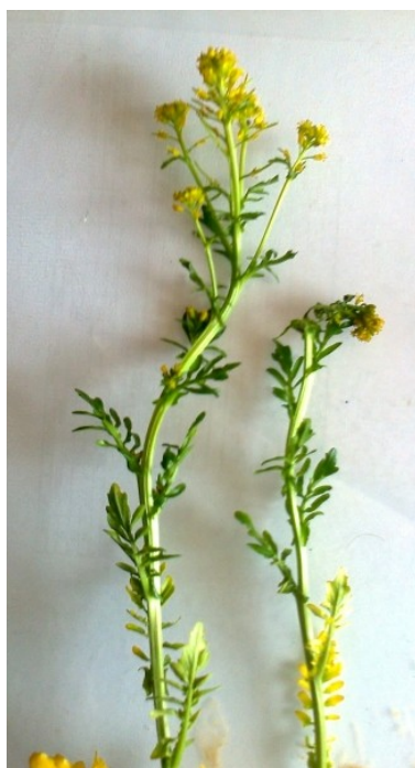
B. intermedia .