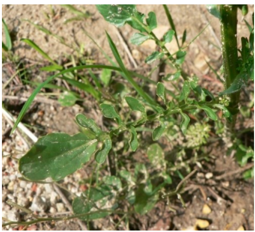
B. verna .