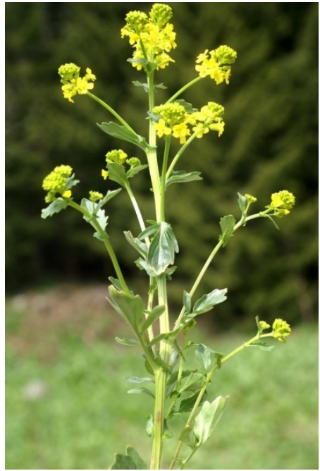
B. vulgaris .