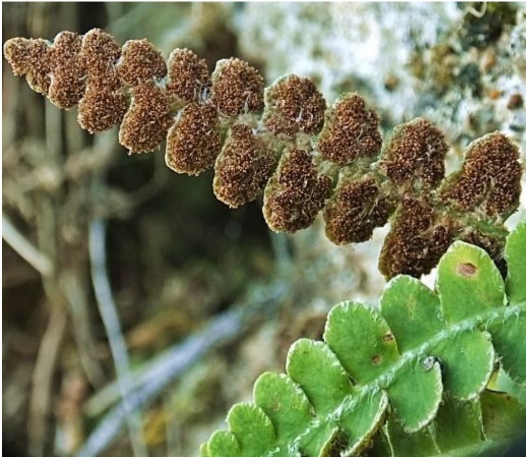
Asplenium ceterach .