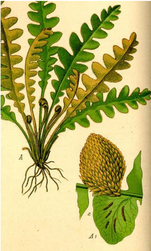
dibuix: THOMÉ, OTTO WILHELM