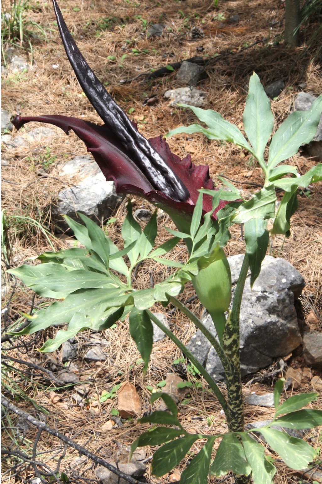
Dracunculus vulgaris .