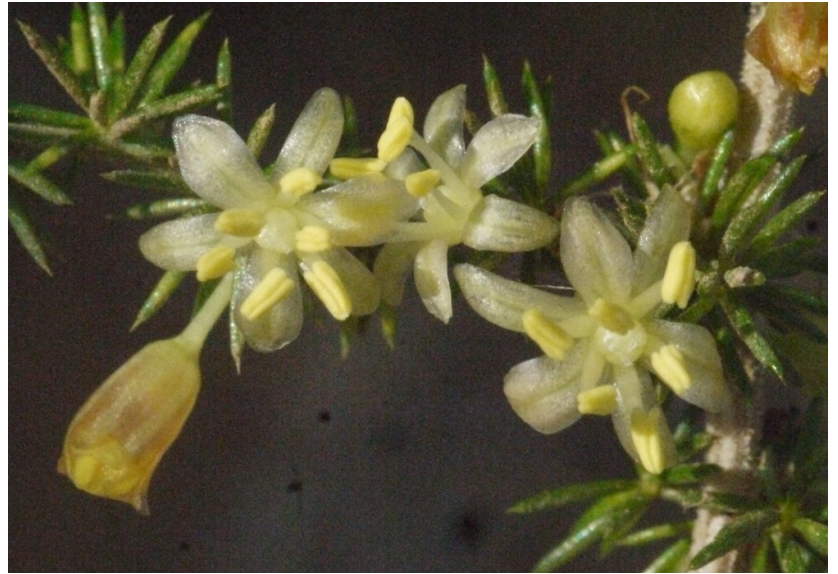
Asparagus acutifolius .