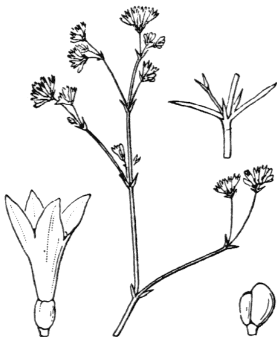
Asperula cynanchica . Imatge: H. COSTE