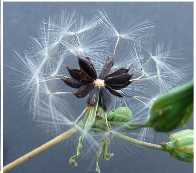
Lactuca virosa : aquenis amb vil·là.