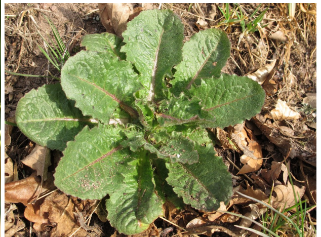
Lactuca virosa : rosetó basal.