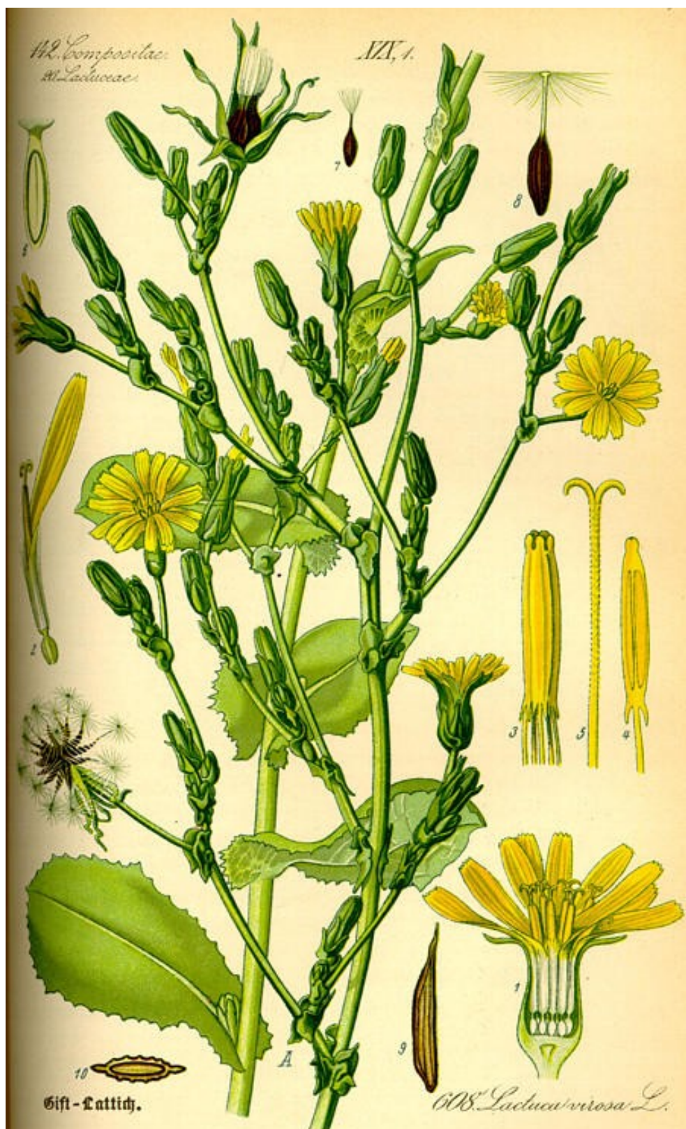
Làmina: THOMÉ, OTTO WILHELM

Lactuca virosa L. [1753, Sp. Pl. : 795] 2n = 18