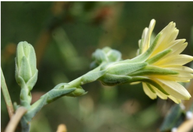
Lactuca virosa .