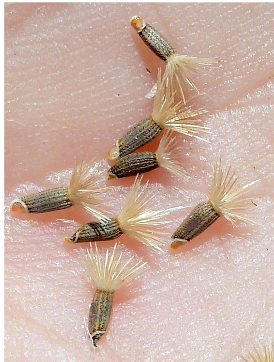
Cípses o aquenis amb vil·là i eleosoma.