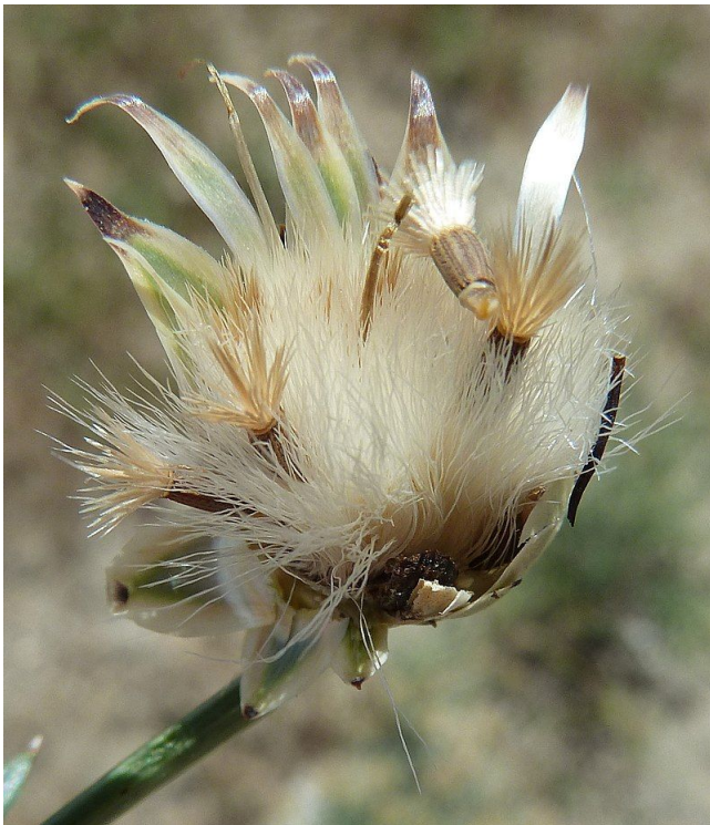
Mantisalca salmantica . Capítol fructificant obert.