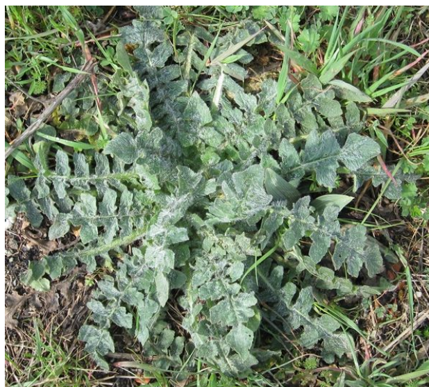
rosetó de fulles basals de Mantiscalca salmantica .