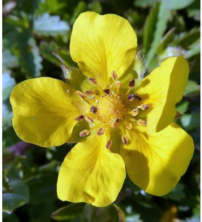
Corol·la de Potentilla reptans .