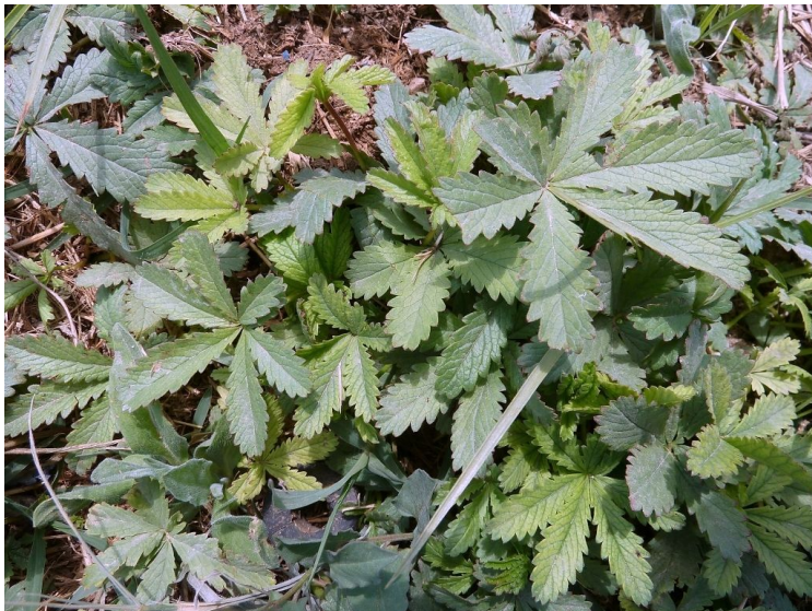
Potentilla reptans .