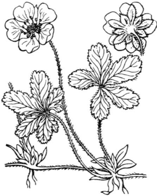
Dibuix. ABBÉ H. COSTE