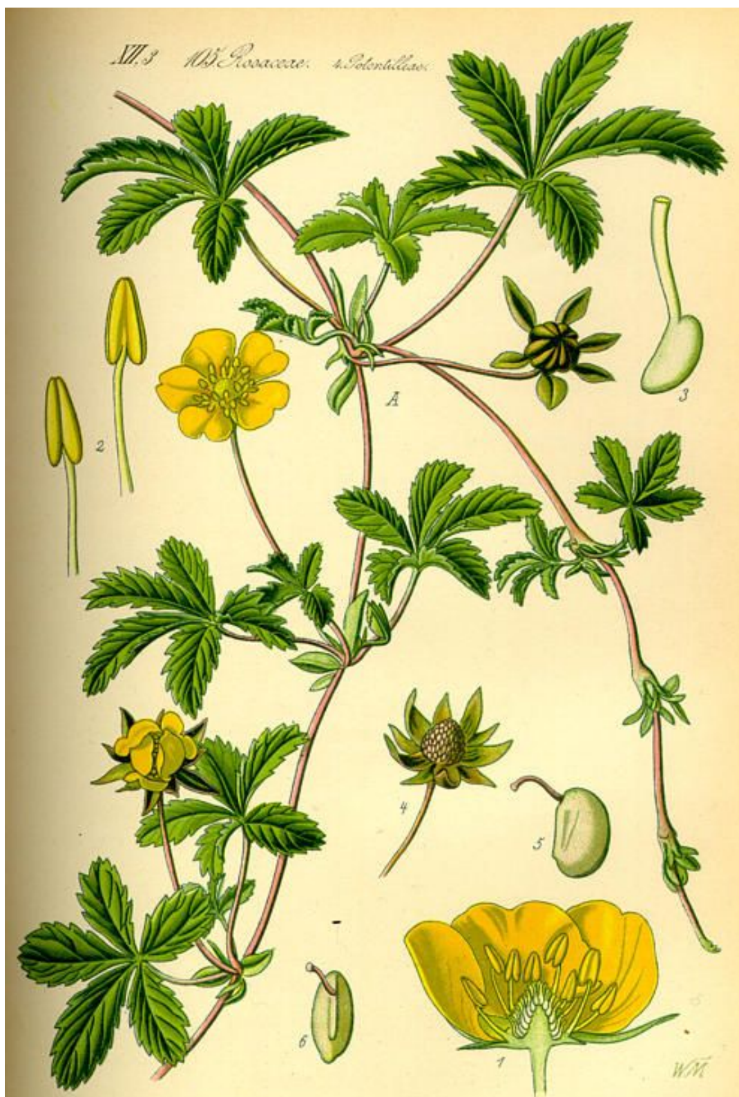
Potentilla reptans . Làmina: THOMÉ, OTTO WILHELM