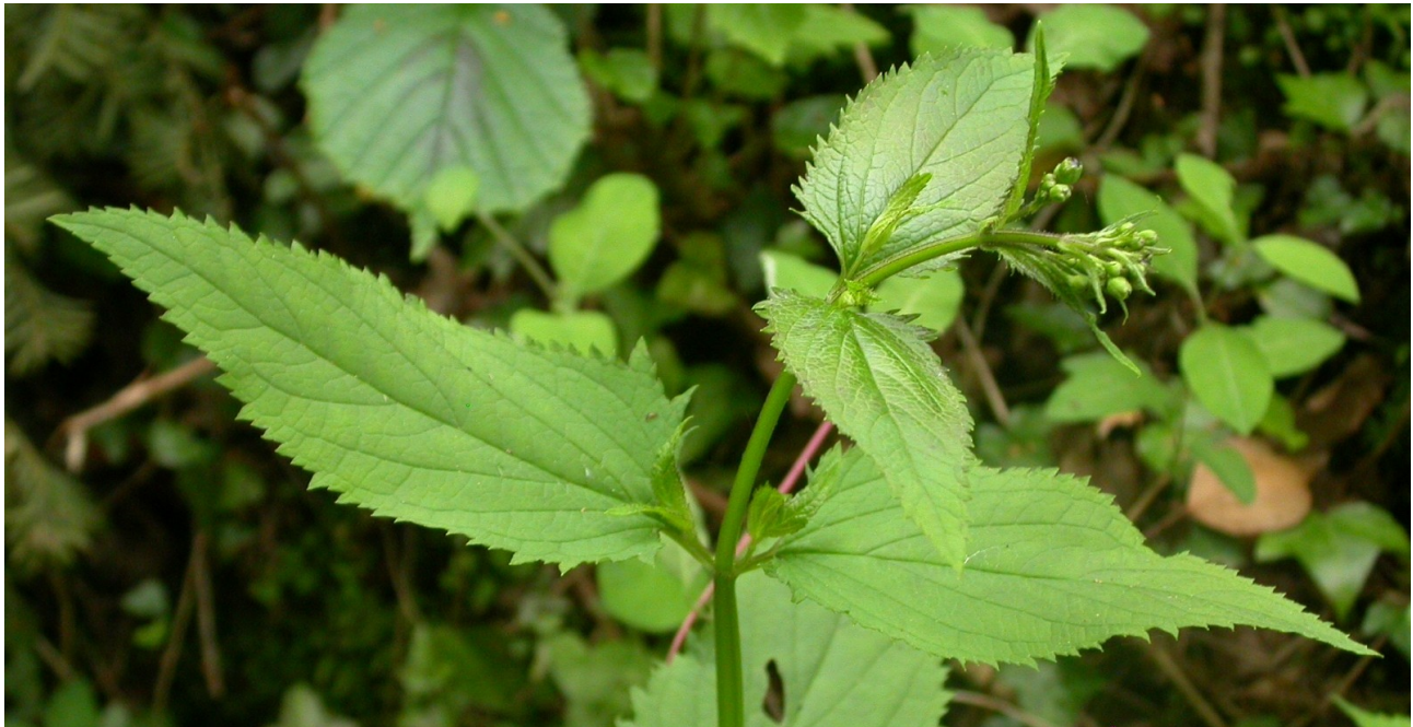
Scrophularia nodosa .