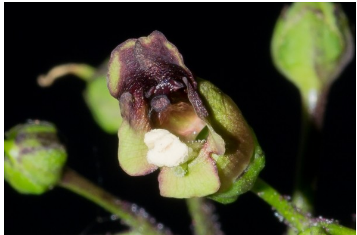
Scrophularia nodosa .