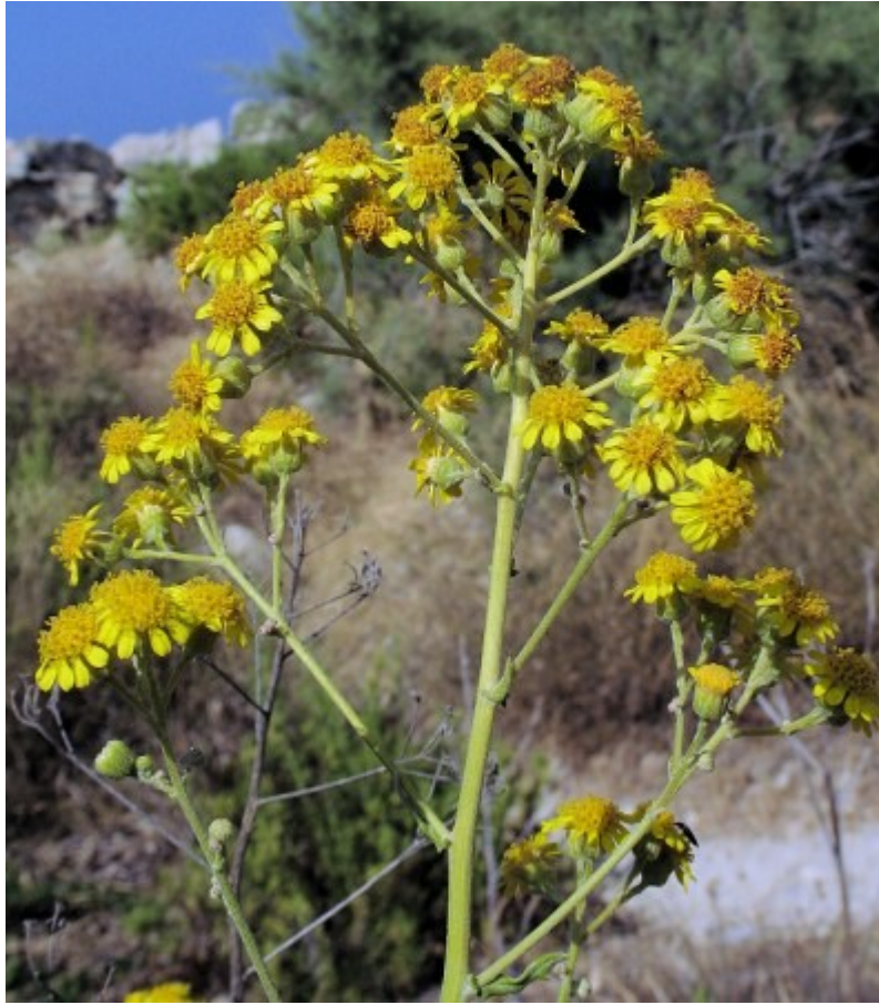
Jacobaea maritima ssp. sicula , de Malta i Sicília