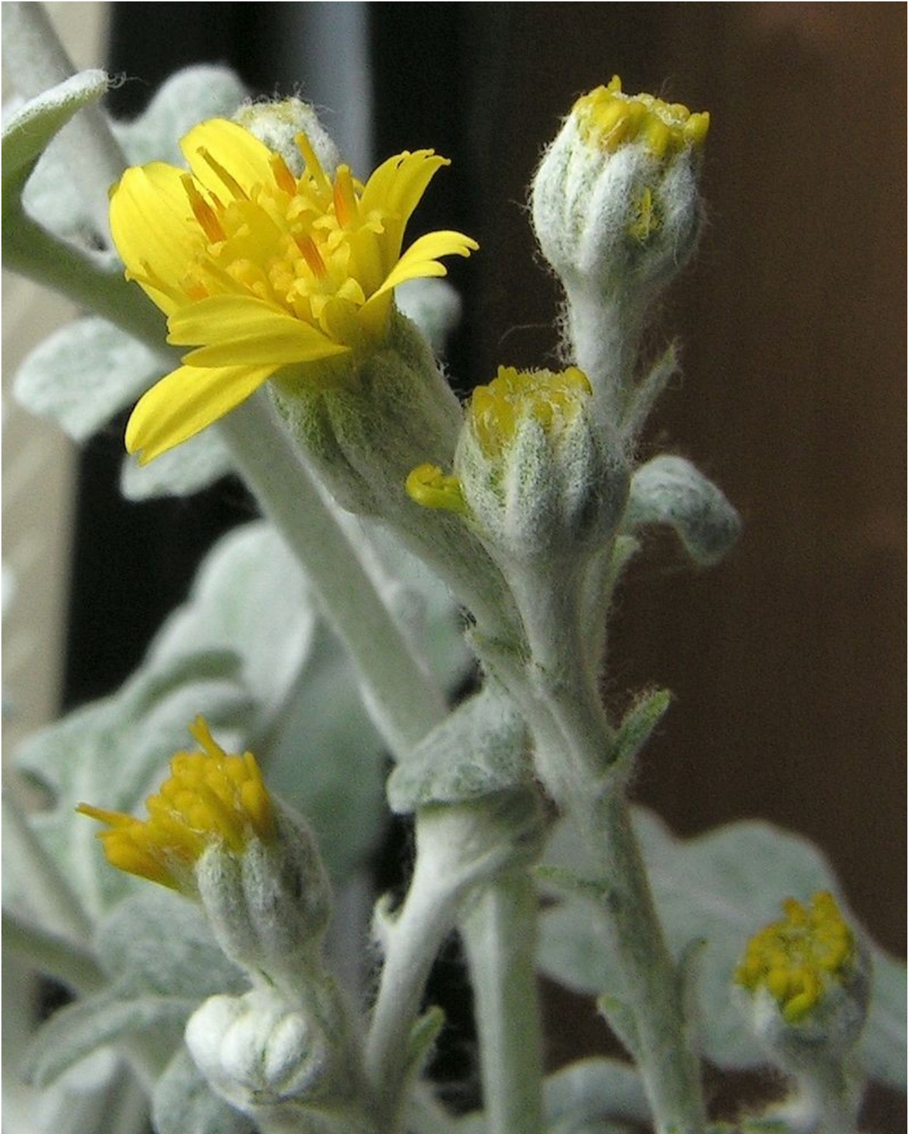
Cineraria maritima .