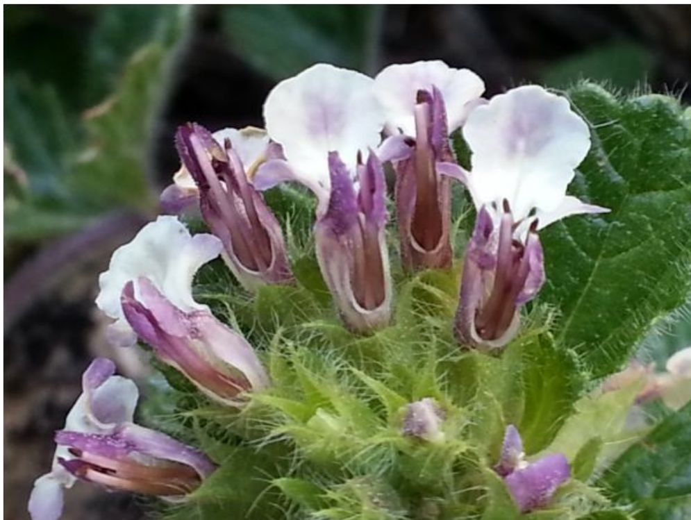
Teucrium pyrenaicum .