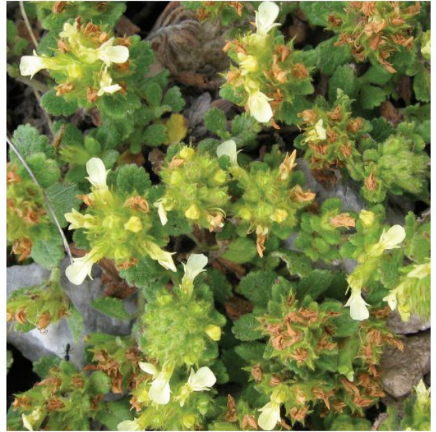
Teucrium × mailhoi notosubespècie orientalis