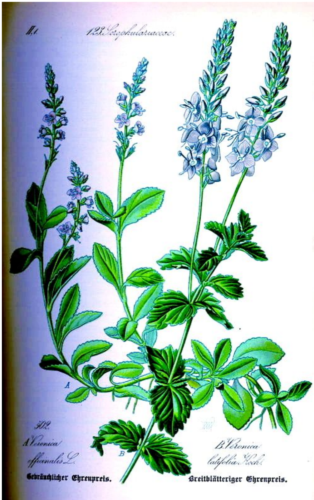
Veronica officinalis L. (imatge de THOMÉ, OTTO WILHELM)