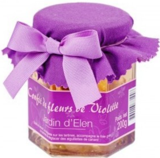
confitura de violeta