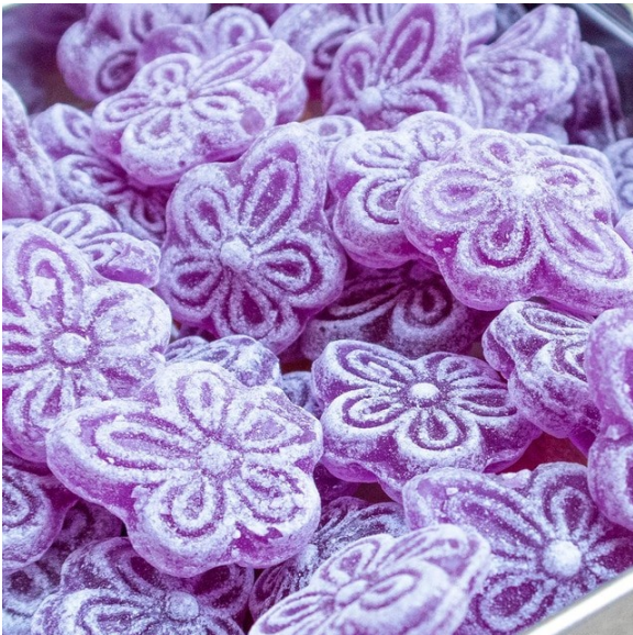
caramels amb sabor a violetes

d'absolut. El tint de les flors s'empra com el tornassol com indicador de pH; es torna vermell en àcids i verd en bases. H. Els ciclòtids de la violeta (cicloviolacina O 1 ) tenen efecte contra el caragol poma ( Pomacea canaliculata ).