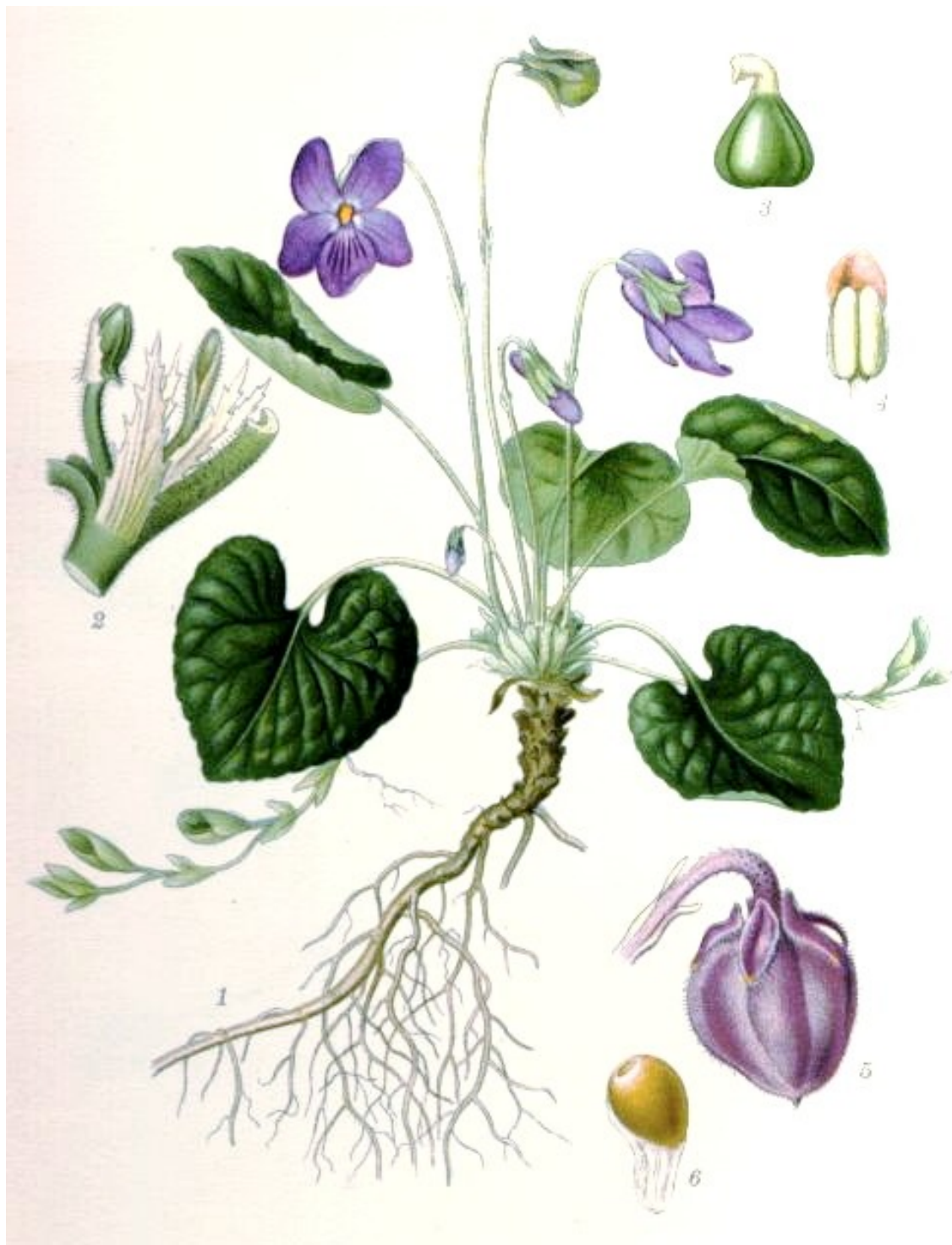
Viola odorata . Làmina: CARL AXEL MAGNUS LINDMANN