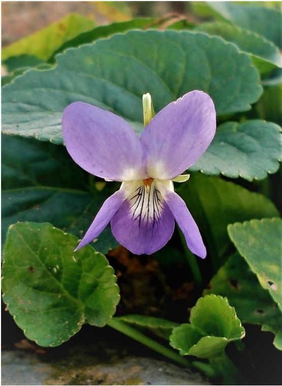
Viola odorata .